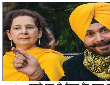
ਜਾਰੀ ਕਰ ਕੇ ਕਿਹਾ ਕਿ ਹਾਲ ਹੀ 'ਚ ਤੁਹਾਡੇ ਪਤੀ ਨਵਜੋਤ ਸਿੰਘ ਸਿੱਧੂ ਨੇ ਤੁਹਾਡੇ ਕੌਰਸ ਰੋਗ ਦੇ ਸੰਬੰਧ 'ਚ ਅੰਮ੍ਰਿਤਸਰ ਸਥਿਤ ਤੁਹਾਡੇ ਘਰ ਇਕ ਪ੍ਰੈੱਸ ਕਾਨਫਰੰਸ ਕਰ ਕੇ ਖੁਲਾਸਾ ਕੀਤਾ ਕਿ ਤੁਸੀਂ ਸਟੇਜ-4 ਕੌਰਸ ਨੂੰ ਲਾਈਵ ਸਟਾਈਲ ਅਤੇ ਡਾਈਟ 'ਚ ਤਬਦੀਲੀ ਕਰ ਕੇ ਹਰਾਇਆ ਹੈ।