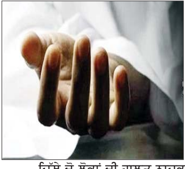
ਜਿੱਥੇ ਦੋ ਲੋਕਾਂ ਦੀ ਹਾਲਤ ਨਾਜ਼ੁਕ ਦੱਸੀ ਜਾ ਰਹੀ ਹੈ। ਪੁਲਿਸ ਨੇ ਦੱਸਿਆ ਕਿ ਮਰਨ ਵਾਲਿਆਂ ਵਿੱਚ ਡੇਢ ਸਾਲ ਅਤੇ ਚਾਰ ਸਾਲ ਦੇ ਦੋ ਬੱਚੇ ਅਤੇ ਦੋ ਅੱਠਤਾਂ ਸ਼ਾਮਲ ਹਨ। ਉਨ੍ਹਾਂ ਦੱਸਿਆ ਕਿ ਗੱਡੀ ਦੇ ਡਰਾਈਵਰ ਅਤੇ ਸਵਾਰੀਆਂ ਨੂੰ ਹਿਰਾਸਤ ਵਿੱਚ ਲੈ ਲਿਆ ਗਿਆ ਹੈ। ਪੁਲਿਸ ਵਲੋਂ ਇਸ ਮਾਮਲੇ ਦੇ ਸਬੰਧ ਵਿਚ ਕਾਰਵਾਈ ਕੀਤੀ ਜਾ ਰਹੀ ਹੈ।

ਪੰਜਾਬ ਦਾ ਖੁਲਾਸਾ ਤ੍ਰਿਸ਼ੂਰ, 26 ਨਵੰਬਰ -- ਕੋਰਲ ਦੇ ਤ੍ਰਿਸ਼ੂਰ ਜ਼ਿਲ੍ਹੇ ਵਿੱਚ ਮੰਗਲਵਾਰ ਤੜਕੇ ਲੋਕਾਂ ਟਰੱਕ ਸੜਕ ਕਿਨਾਰੇ ਲੱਗੇ ਟੈਂਟ ਵਿੱਚ ਦਾਖਲ ਹੋ ਗਿਆ, ਜਿਸ ਕਾਰਨ ਦਰਦਨਾਕ ਹਾਦਸਾ ਵਾਪਰ ਗਿਆ। ਇਸ ਹਾਦਸੇ ਕਾਰਨ ਟੈਂਟ ਵਿਚ ਸੌ ਰੋਹੇ ਦੋ ਬੱਚਿਆਂ ਸਮੇਤ ਘੱਟੋ-ਘੱਟ ਪੰਜ ਲੋਕਾਂ ਦੀ ਮੌਤ ਹੋ ਗਈ ਅਤੇ ਕਈ ਹੋਰ ਜ਼ਖਮੀ ਹੋ ਗਏ। ਇਸ ਘਟਨਾ ਦੀ ਜਾਣਕਾਰੀ ਪੁਲਿਸ ਵੱਲੋਂ ਦਿੱਤੀ ਗਈ ਹੈ। ਪੁਲਿਸ ਨੇ ਦੱਸਿਆ ਕਿ ਖਾਨਾਬਦੋਸ਼ ਲੋਕ ਵਲਪੜ ਪੁਲਸ ਥਾਣਾ ਖੇਤਰ ਦੇ ਅਧੀਨ ਨਟੋਕਾ ਵਿਖੇ ਰਾਸ਼ਟਰੀ ਰਾਜਮਾਰਗ ਦੇ ਕਿਨਾਰੇ ਆਪਣੇ ਤੰਬੂਆਂ ਵਿੱਚ ਸੌ ਰਹੇ ਸਨ। ਉਹਨਾਂ ਕਿਹਾ ਕਿ ਇਸ ਦੌਰਾਨ ਸਵੇਰੇ 4.30 ਵਜੇ ਦੇ ਕਰੀਬ ਇਕ ਕੁਝ ਰਫ਼ਤਾਰ ਟਰੱਕ ਨੇ ਉਨ੍ਹਾਂ ਨੂੰ ਕੁਚਲ ਦਿੱਤਾ। ਉਨ੍ਹਾਂ ਦੱਸਿਆ ਕਿ